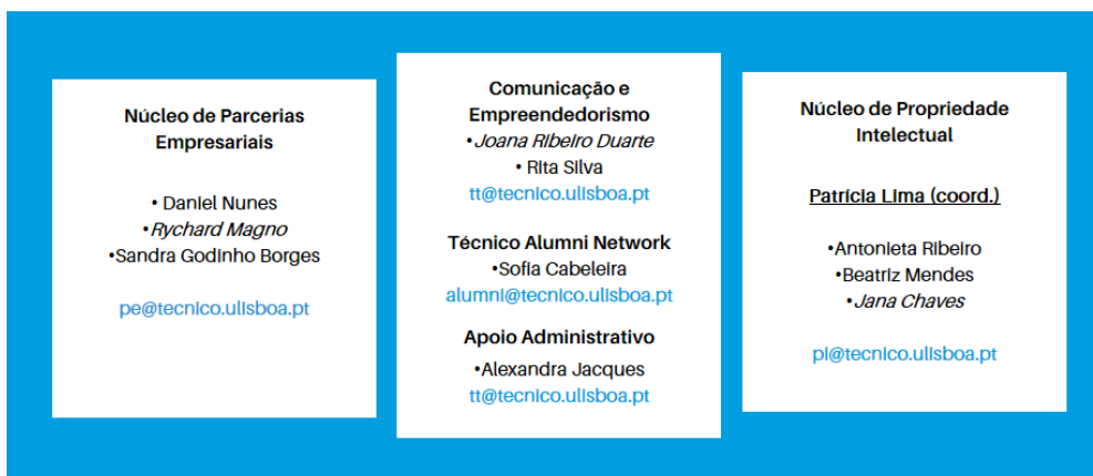
Figura 2: Equipa da TT@Técnico em 31.12.2020.

O ano de 2020 avizinhava-se desde o primeiro dia como desafiador com a mudança dos órgãos de gestão, sendo exetável uma mudança na estratégia a ser desenvolvida nas várias áreas de atuação da TT@Técnico resultantes desta mudança. Na realidade com o avançar do ano de 2020 evidenciaram-se vários desafios adicionais: várias alterações na estrutura hierárquica de que a TT@Técnico depende (3 mudanças ao longo do de 2020), e a instabilidade inerente na condução do serviço, uma pandemia sem precedentes que não só mudou todos os modelos de trabalho, como pela imprevisibilidade do seu aparecimento e evolução consumiu muito (demasiado) tempo em atividades de planeamento, reformulação de projetos e burocracias administrativas, e, finalmente, o crescimento das atividades do serviço decorrentes da estratégia implementada ao longo dos últimos anos.