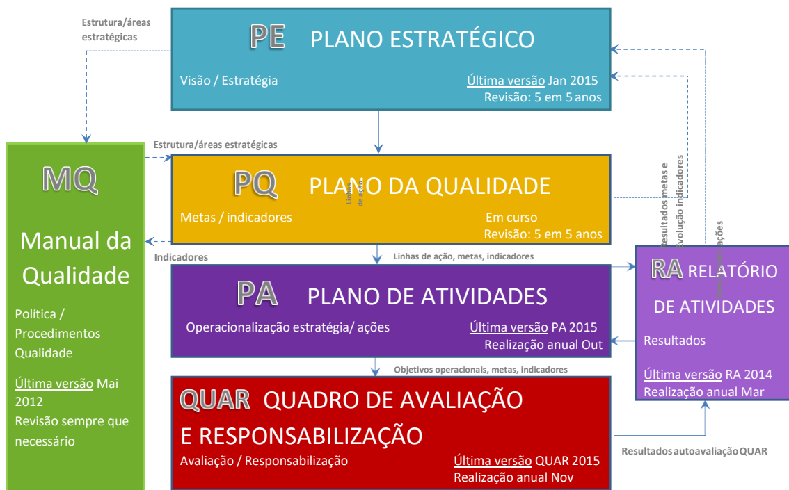
Figura 1 – Documentos de gestão estratégica do IST